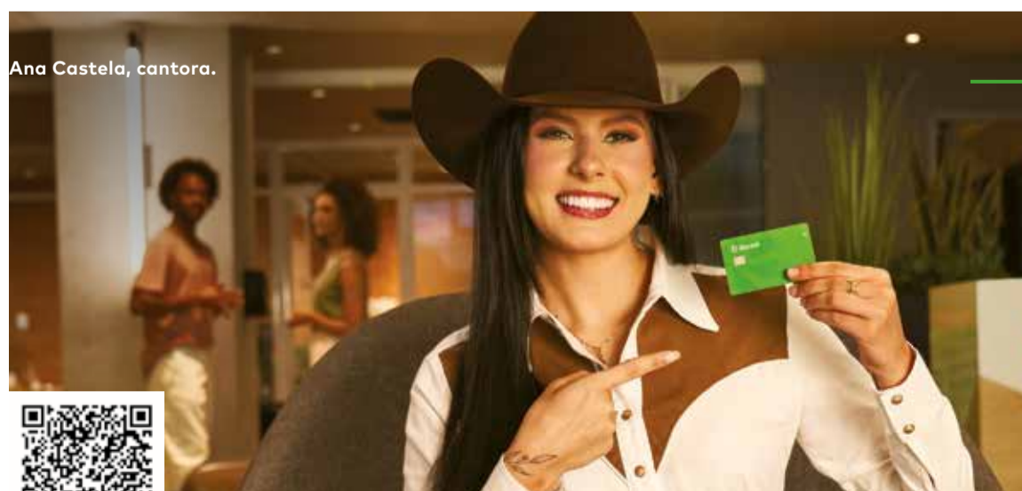
Ana Castela, cantora.