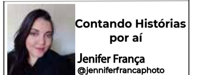
Contando Histórias por aí