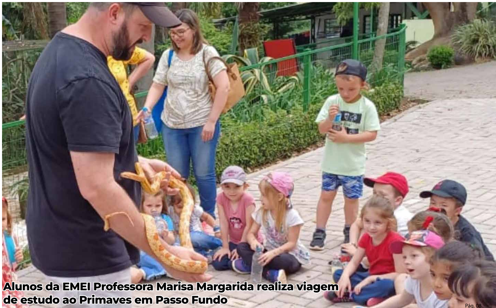
Alunos da EMEI Professora Marisa Margarida realiza viagem de estudo ao Primaves em Passo Fundo

Ernestina- Tio Hugo - Mormaço - Ibirapuitã - Nicolau Vergueiro - Lagoa dos Três Cantos - Victor Graeff - Santo Antônio do Planalto