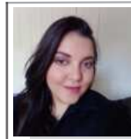
Contando Histórias por aí